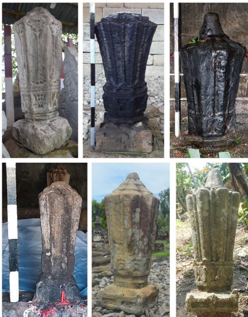
Gambar 4. Sampel Nisan Aceh Tipe K di Sulawesi Selatan

Kiri atas nisan Lasangkuru Patau Mulajaji, tengah atas nisan La Pattiware Petta Mattinroe ri Ware Pattimang, kanan atas nisan Sultan Mudaffar, kiri bawah nisan Sultan Hasanuddin, tengah bawah nisan We Tenri Kawareng, kanan bawah nisan samping La Pakkoe Arung Timurung