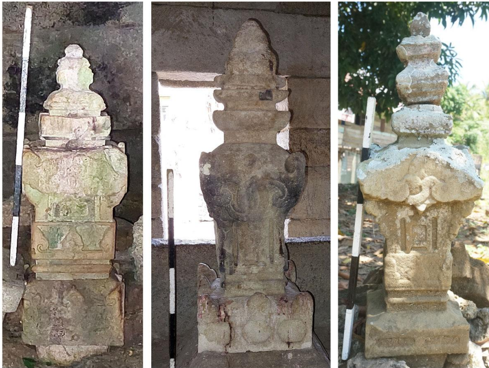
Gambar 3. Sampel Nisan Aceh Tipe H di Sulawesi Selatan

Kiri nisan Sultan Alauddin, tengah nisan Sultan Abdul Kadir, kanan nisan La Pakkoe Arung Timurung