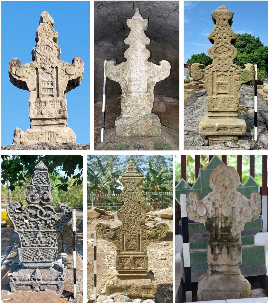
Gambar 2. Sampel Nisan Aceh Tipe C di Sulawesi Selatan

namun tidak diketahui secara pasti periode hidup dan wafatnya tokoh ini. Kerajaan Punaga sendiri adalah palili dari Kerajaan Bangkala di Jeneponto sejak abad ke-16 hingga 17 M (Hadrawi, 2017, p. 125). Diceritakan oleh Caldwell & Bougas (1992) bahwa Punaga adalah sebuah wilayah di